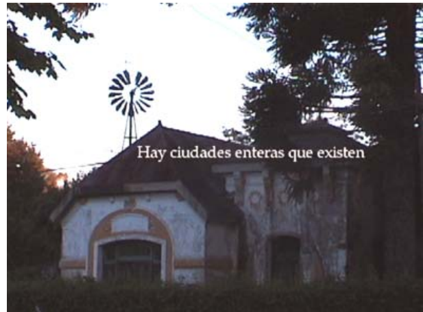
Mara Facchin. Ocho casas perfectamente iguales . 2003.

Si pensamos en la geografía como ciencia, no podemos dejar de suponer una cierta estabilidad del mundo. Una espacialidad de naciones y fronteras, ciudades y rutas, centros y periferias, sólo puede sustentarse sobre un territorio de propiedades constantes, o a lo sumo, sobre uno regido por el reloj de la naturaleza, con procesos de cambio lentos e imperceptibles.