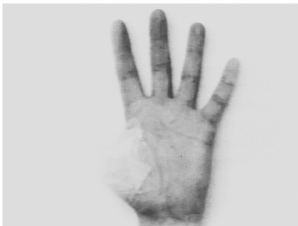
Los Paseos Nocturnos . 1994.

Es por eso que no podemos dejar de extrañarnos cuando la imagen nos revela nuestro entorno más inmediato. Lo sublime, pero también lo banal, tienen en la obra de Francisco Ruiz de Infante, la contundencia de lo inusual, simplemente por que el artista ha decidido que debamos retransitar su experiencia, reinsertando en el ejercicio de los sentidos la complejidad del vínculo del hombre con su propia naturaleza.