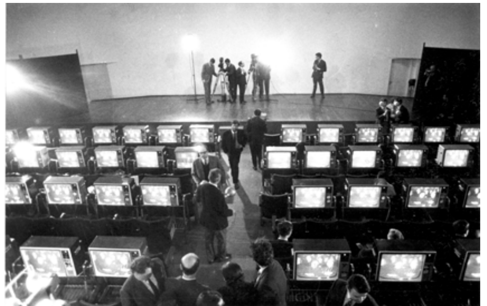
Marta Minujin. Simultaneidad en Simultaneidad. 1966