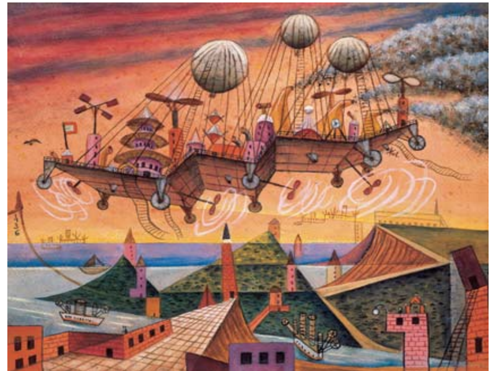
Xul Solar. Vuel Villa. 1936

Las referencias a la ciencia encontraron existencia formal en la exaltación de las estructuras geométricas y matemáticas; su objetivo era suprimir el individualismo a favor de un arte de impacto social. Esta base científica persistirá e incluso se incrementará en los diferentes grupos que emergieron a partir del núcleo concreto original: el Perceptismo y Madi. De este último emergerían los primeros experimentos específicos con tecnología.