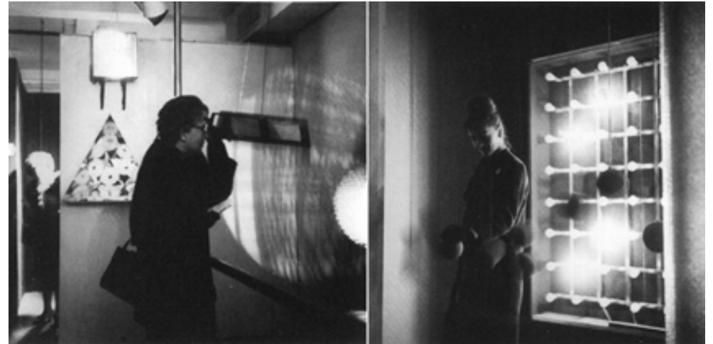
GRAV. Laberinto. 1963

Esas obras pioneras oscilaron entre dos polos diferenciados. Por un lado, exaltaron el aspecto sensorial de la relación entre imagen y espectador, influenciadas por la recuperación sensorial de la cultura hippie; por otro, artistas afines a la incipiente tendencia conceptual destacaron el componente informativo de la imagen y su capacidad para referir a la realidad. En 1966, tras haberse nutrido de la cultura hippie y de las teorías de Marshall McLuhan en los Estados Unidos, Marta Minujin comienza una serie de obras que exaltan la mediatización de la experiencia cotidiana,