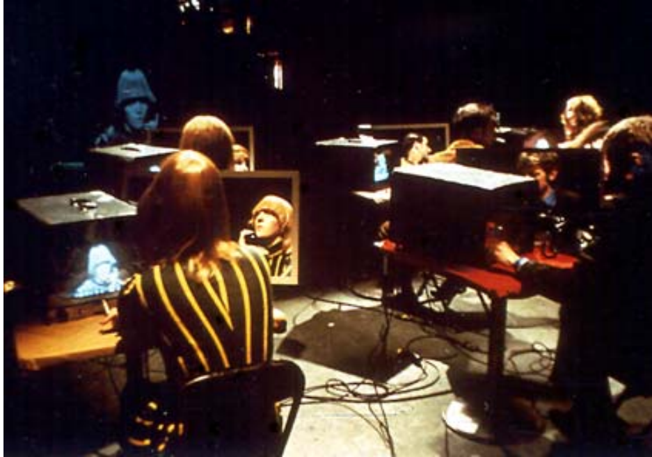
Marta Minujin. Circuito . 1967

sumergiendo al espectador en el universo visual e hiper-fragmentado de los mass media.