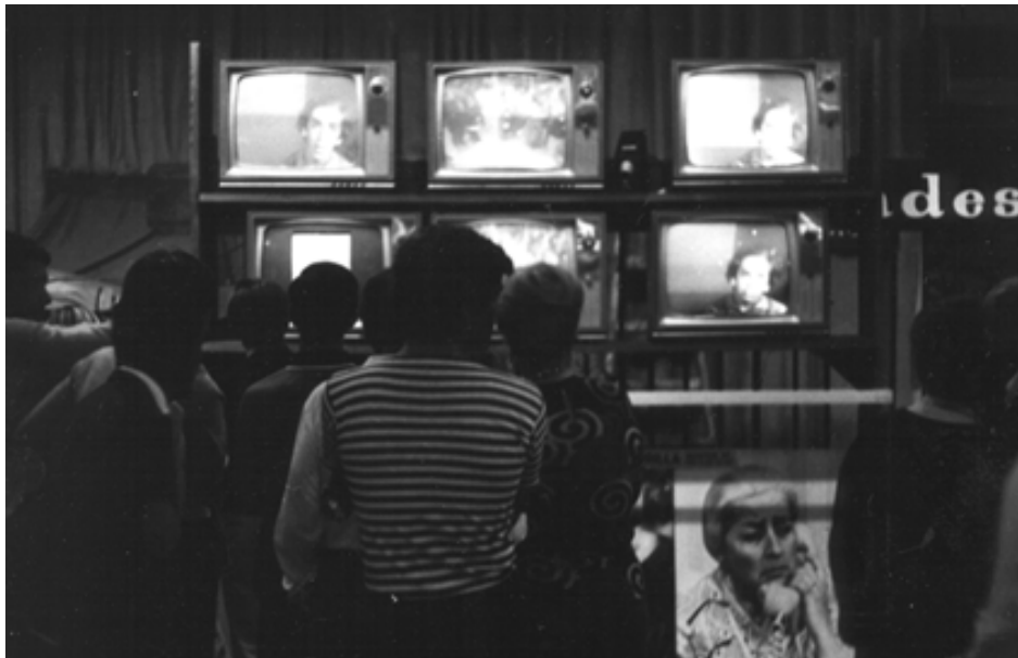
Grupo Frontera. Especta . 1969

Lea Lublin utilizó proyecciones cinematográficas en Dentro y Fuera del Museo (1971), una obra que buscaba instaurar un diálogo entre los acontecimientos políticos, sociales y culturales, y el desarrollo artístico concomitante. Para esto, Lublin instaló pantallas que proyectaban documentales sobre el arte frente a un museo y ubicó en su interior diagramas que comparaban acontecimientos históricos destacados con el desarrollo artístico del mismo período. El cine no es aquí sólo un medio informativo, sino el medio más adecuado para llegar a un público ajeno a la institución.