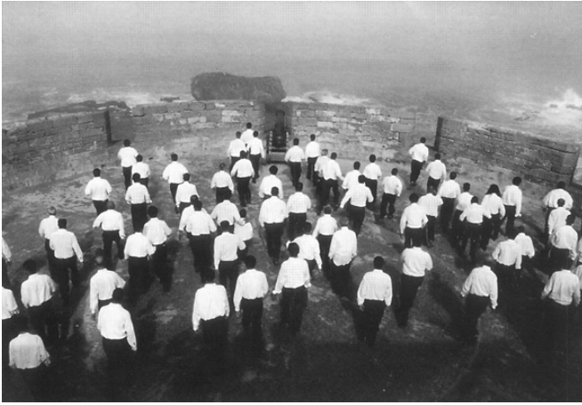
Shirin Neshat. Rapture . 1999.