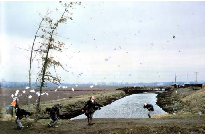
Jeff Wall. A Sudden Gust of Wind (After Hokusai) . 1993.